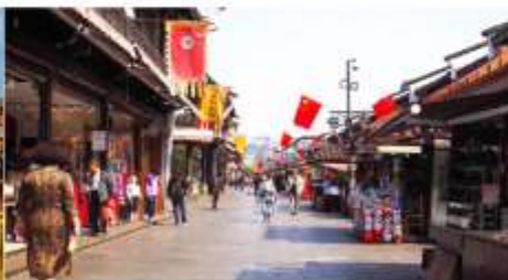
ถนนโบราณเหอฟางเจีย