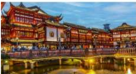
ตลาดร้อยปีเงินหวงเมี่ยว