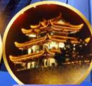
หอคอยทองคำเทียนจิน