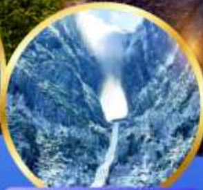
ประติมากรรม หิมะเหมินชาน