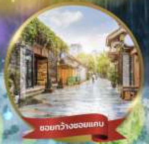
ชอยกว้างชอยแคบ