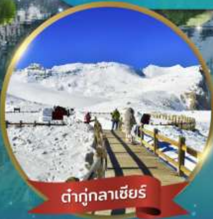
ต่ากู่กลาเซียร์