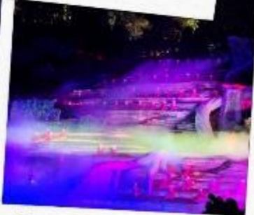
โชว์นางจิ้งจอกขาว