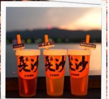
เซียงเจียงริเวอร์ไซด์