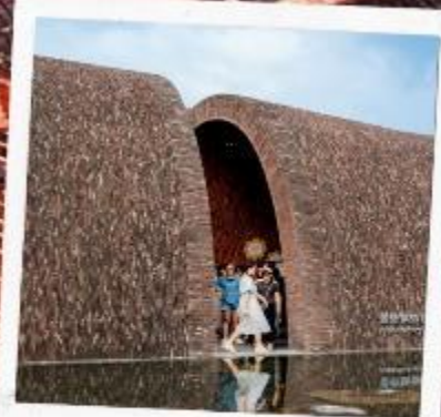
จิ่งเต๋อเจิ้น