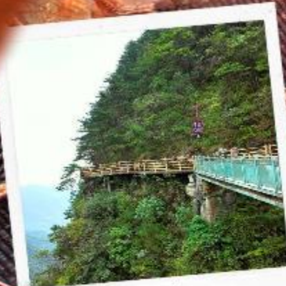
หมิงเยวี่ยซาน