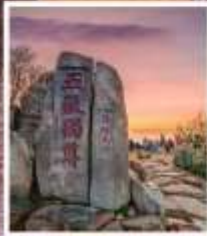
หินแกะสลักในสมัย ราชวงศ์ถัง