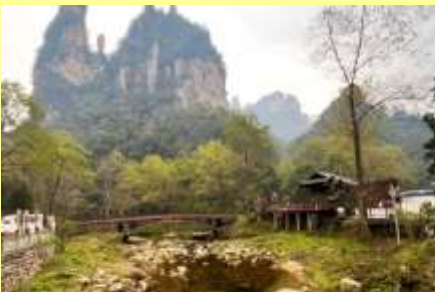
จุดชมวิวจินเปียนชี่

หลังอาหารเช้าให้ท่านพักผ่อนตามอัธยาศัยในโรงแรม หรือ ท่านสามารถเลือกซื้อโปรแกรมเสริม OPTIONAL TOUR รายการใดรายการหนึ่ง ซึ่งเป็น โปรแกรมท่องเที่ยวที่ไม่ได้รวมอยู่ในรายการท่องเที่ยว ซึ่งมีด้วยกัน 3 โปรแกรม ได้แก่