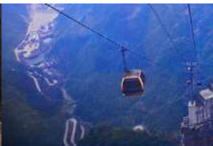
กระเช้าขึ้นเทียนเหมินซาน