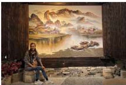
พิพิธภัณฑ์ภาพเขียนหินทราย

พักที่ ZHENMIAN HOTEL OR YINXIANG HOTEL ระดับ 4 ดาวท้องถิ่นหรือเทียบเท่าในเมืองจางเจี๋ยเจี๋ย