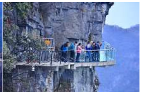
หน้าผาลอยฟ้าทางเดินกระจก