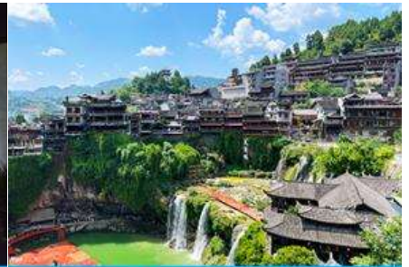
เมืองโบราณฝูหรงเจี้ยน