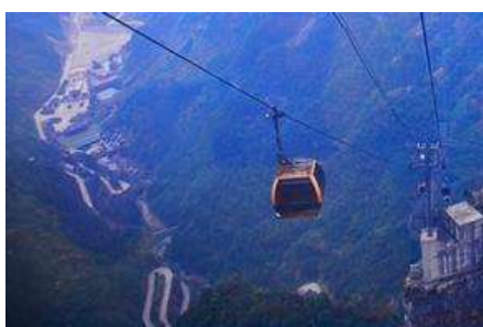
กระเช้าขึ้นเขายเทียนเหมินซาน

https://hk.trip.com/hotels/guzhang-hotel-detail-68614854/chaxitai-holiday-hotel/