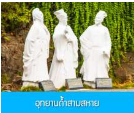
อุทยานถ้ำสามสหาย