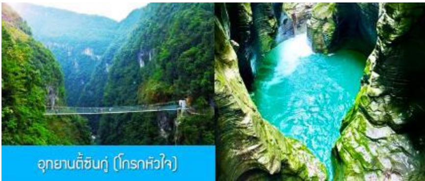
อุทยานตี้ซินกู่ (โกรกหัวใจ)

พักที่ โรงแรม ENSHI XIPU HOTEL ระดับ 4 ดาวท้องถิ่นหรือเทียบเท่าในเมืองเอินซือ