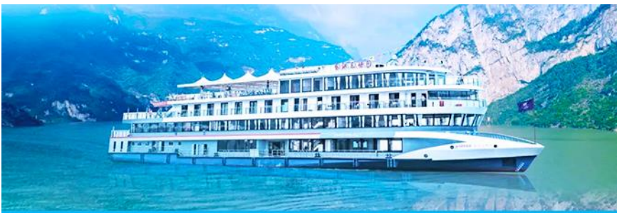
ล่องเรือชมเขื่อนสามผา