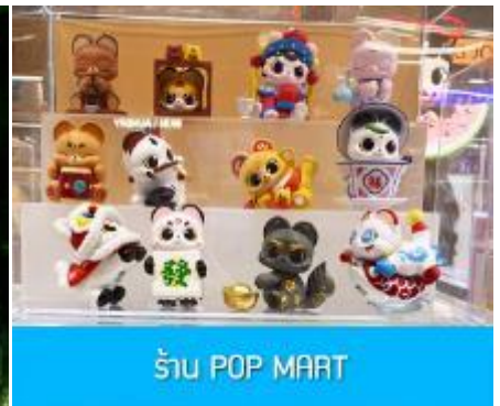
ร้าน POP MART

วันที่ห้า เมืองเอินซือ – อุทยานตี้ซินกู่ (โกรกหัวใจ) – เมืองหยีซัง – ซุปเปอร์มาร์เก็ต CBD – POP MART