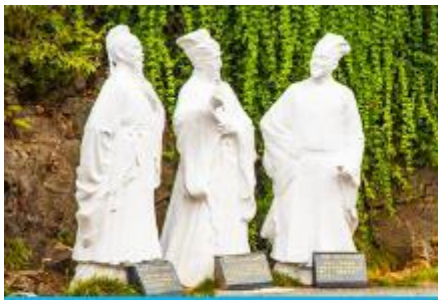
อุทยานถ้ำสามสหาย