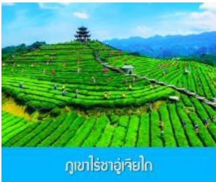
ภูเขาไร่ชาอุเจียโก

พักที่ โรงแรม ENSHI XIPU HOTEL ระดับ 4 ดาวท้องถิ่นหรือเทียบเท่าในเมืองเอนซือ