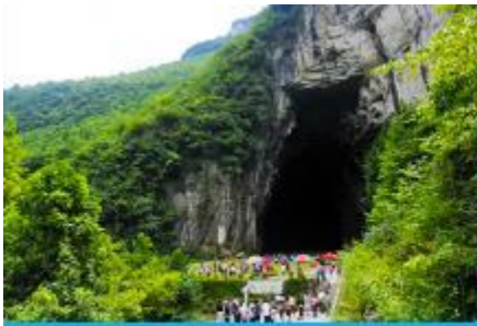
ถ้ำพญามังกร

พักที่ YICHANG HUIHAO HOTEL โรงแรมระดับ 4 ดาวหรือเทียบเท่าในเมืองหฺยซัง