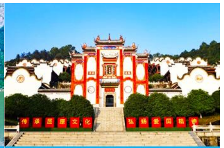
บ้านเกิดกวี ชวีหยวน