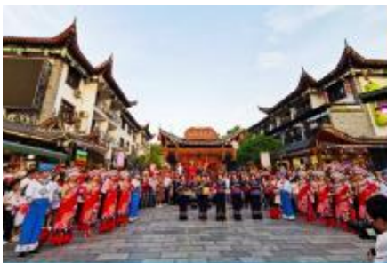
เมืองเทพริดา