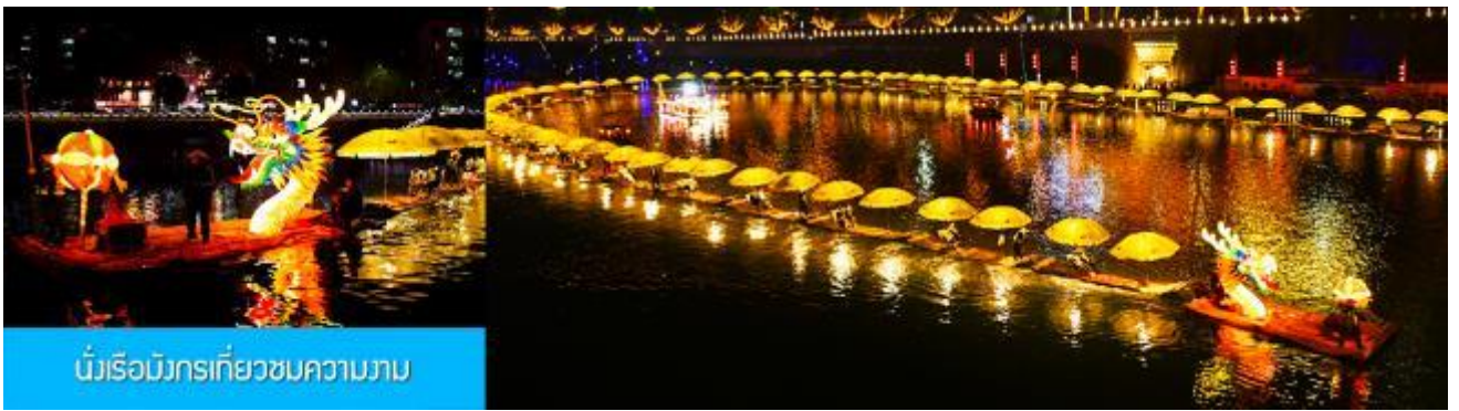
นั่งเรือมังกรเที่ยวชมความงาม

หลังอาหารนำท่านเดินทางเข้าที่พัก หรือท่านสามารถเลือกซื้อ โปรแกรมเสริม เป็นตัวนั่งเรือมังกรเที่ยวชมความงามของ บ้านเรือนและสิ่งปลูกสร้างสองฝั่งแม่น้ำในช่วงที่สวยงามที่สุดของเมือง เซียนเอิน ที่ประดับประดาด้วยแสงสี และได้ชื่อว่าเป็นวิวยามค่ำคืนที่สวยงามที่สุดในมณฑลหูเป่ย์ เช่นเดียวกับเมือง โบราณฟงหวงในมณฑลหูหนาน.....อัตราค่าบริการสำหรับ โปรแกรมเสริมนั่งเรือมังกรชมวิวยามค่ำคืน ท่านละ 190 หยวน หรือ 950 บาท ระยะเวลาที่ใช้ในการเรือมังกร ประมาณ 45 นาที ค่าบริการรวม ค่าบัตรเข้าชม ค่ารถรับ ส่ง และค่านำเที่ยวของไกด์ท้องถิ่น