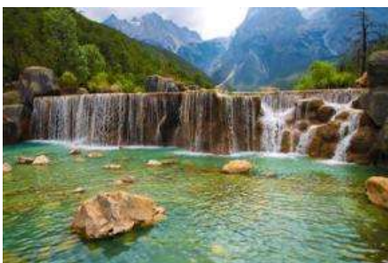
หุบเขาพระจันทร์สีน้ำเงิน "ไปสู่อุ้ยเหอ"

เมื่อคณะโดยสารกระเช้าลงจากภูเขาหิมะมังกรหยก