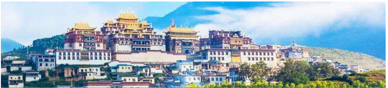
เมืองโบราณเซงกรีล่า