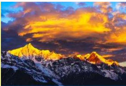
กูเขาหิมะเหมยหลี่

หลังอาหารเช้าท่านเข้าสู่โรงแรมที่พักในเมืองเต๋อชิง ให้ท่านพักผ่อนหรือเดินเล่นถ่ายภาพในเมืองตามอัธยาศัย