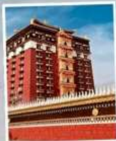
หอเก็บพระไตรปิฎก มิลารเปะ