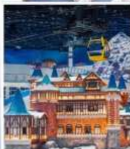
SHANGHAI YAOXUE SNOW WORLD