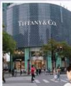
ถนนหวยไห่