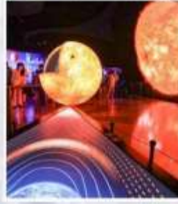
ท้องฟ้าจำลองเซี่ยงไฮ้