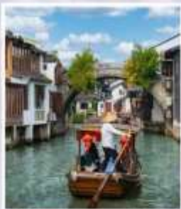
หมู่บ้านโบราณจูเจียเจี้ยว