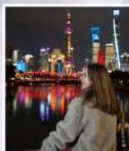
เซี่ยงไฮ้ คลาสสิก ไทท์