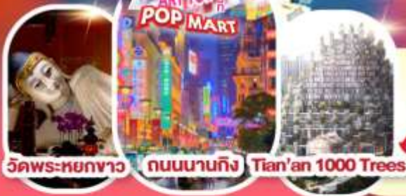
วัดพระหยกขาว ถนนนานกิง Tian'an 1000 Trees