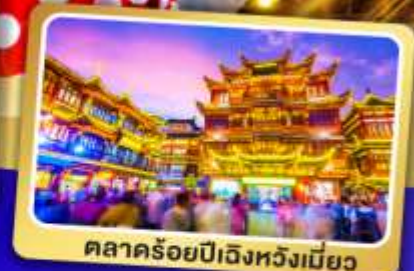
ตลาดร้อยปีเฉิงหวงเหมียว