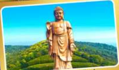
พระใหญ่หลังซานต้าฝอ