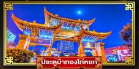
ประตูน้ำทองโก่หยก