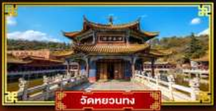
วัดหยวงทง

มหัศจรรย์ "แผ่นดินสีแดงตงชว่น" นั่งกระเช้าขึ้นสู่อยอดภูเขาหิมะเจียวจื่อ