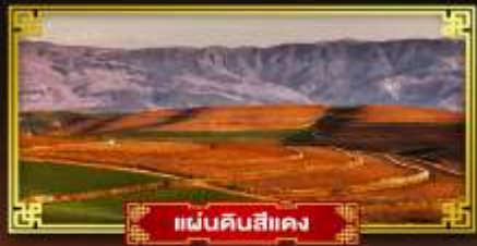
แผ่นดินสีแดง