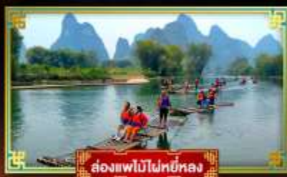
ล่องแพไม้ไผ่หยอง