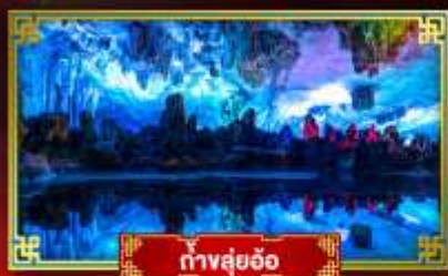
ทิวสวยอ้อ

"ดินแดนแห่งสายน้ำและขุนเขา" สัมผัสประสบการณ์นั่งบอลลูนชมวิวมุมสูง