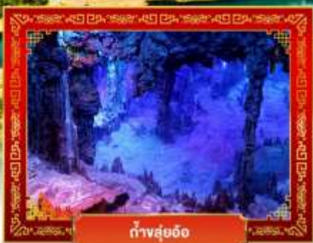
ถ้ำสุ่ยอ้อ