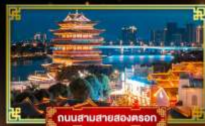
ถนนสามสายสองตรอก