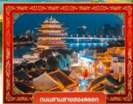
ถนนสามสายสองคอน