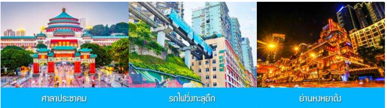
ศาลาประชาชน

พักที่ DAWEI YING HOTEL โรงแรมระดับ 4 ดาวหรือเทียบเท่าในเมืองอู่หลง