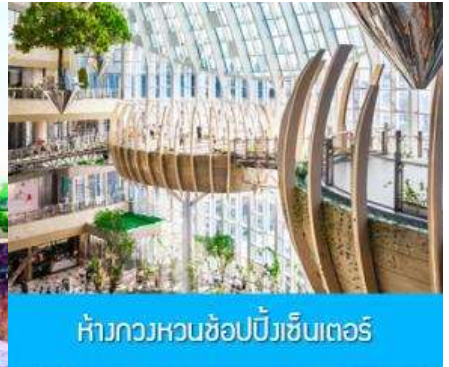
ห้างกวงหวนช้อปปิ้งเซ็นเตอร์

วันที่ห้า เมืองจงซิง-เมืองโบราณฉือชิว-กวงหวนช้อปปิ้งคอมเพล็กซ์ –บินกลับกรุงเทพ (ดอนเมือง)