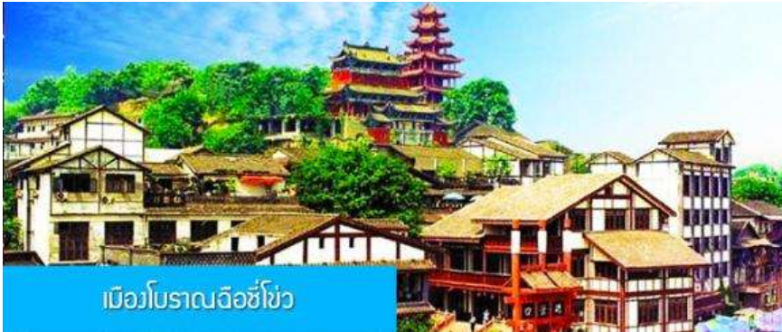
เมืองโบราณฉือชิว

พักที่ BORRMAN HOTEL โรงแรมระดับ 4 ดาวหรือเทียบเท่าในเมืองจงซิง