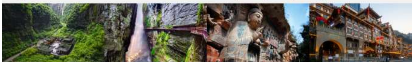
อุทยานแห่งชาติหลุมฟ้า 3 สะพานสวรรค์ หุบเขารอยแยกอู๋หลงชาน ผาหินแกะสลักต้าจู้ เขาเป่าติงชาน หงหยาดิง

*ทางบริษัท ขอสงวนสิทธิ์ในการส่งโปรแกรมทัวร์ตามความเหมาะสมขึ้นอยู่กับสถานการณ์เฉพาะงาน โดยหนึ่งถึงผลประโยชน์ของลูกค้าเป็นหลัก