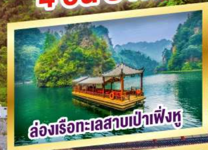
ล่องเรือทะเลสาบเป่าเฟิ่งหู