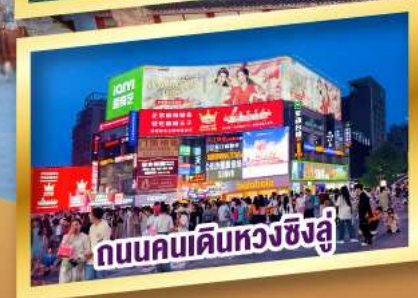
ถนนคนเดินหวงชิ่งลู่