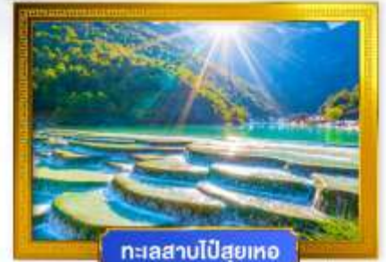
ทะเลสาบไป๋สฺยเหอ