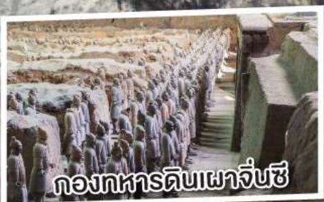
กองทหารดินเผาจีนซี