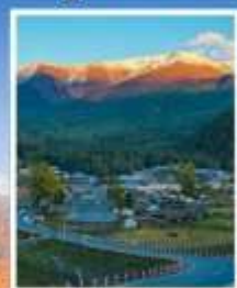
หมู่บ้านไปฮาปา