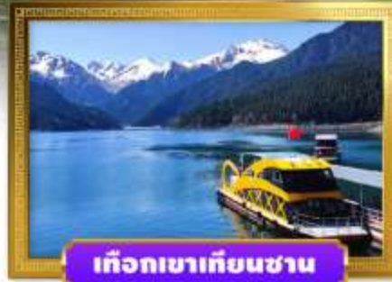
เทือกเขาเทียนชาน