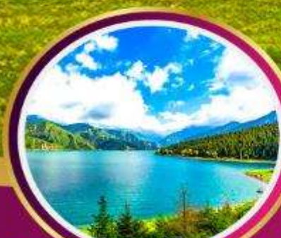
ทะเลสาบเทียนชาน