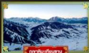
ภูเขาเทียนชาน