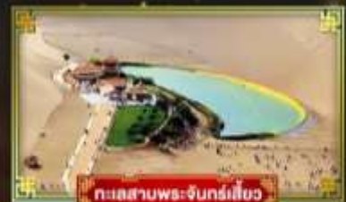
ทะเลสาบพระจันทร์เสี้ยว