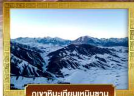
ภูเขาหิมะเทียนเหินซาน