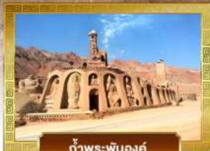
ก้ำพระปันองค์