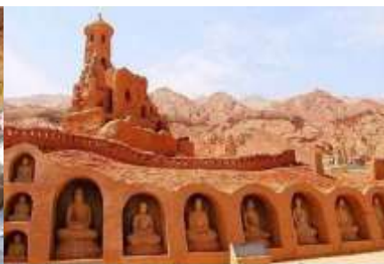
กำแพงเมือง