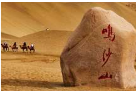
เป็นทรายหับซาฮาน

หลังอาหารให้ท่าน มีเวลาเดินเล่น ช้อปปิ้งใน ตลาดกลางคืน ซาโจว 沙洲夜市 ให้ท่านเลือกซื้อของที่ระลึกของเส้นทางสายไหมได้ตามอัธยาศัย