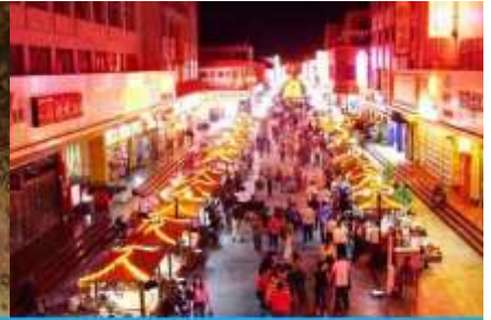
ตลาดกลางคืน ซาโจว

วันที่สี่ ด่านเจียชวี๋กวน – เดินทางสู่เมืองตุนหวง – เที่ยวชมถ้ำมั่วเกาคุ – ชมภาพยนตร์ 3 มิติ-ซาโจวไนท์ มาร์เก็ต