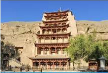
ถ้ำหินมั่วเกาคุ

พักที่ REZEN HOTEL ระดับ 4 ดาวท้องถิ่นหรือเทียบเท่าในเมือง เจียชวี๋กวน