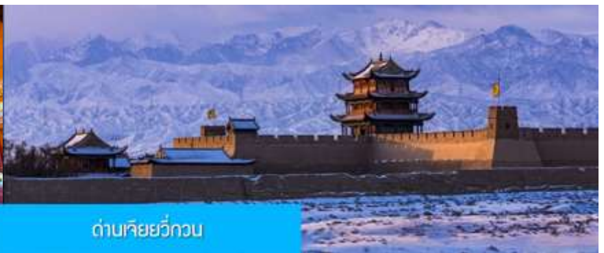
ด่านเจียยวี่กวน

วันที่สาม เมืองจางเยี่ยน – วัดพระใหญ่เมืองจางเยี่ยน –เดินทางสู่เมืองเจียยวี่กวน-ด่านเจียยวี่กวน