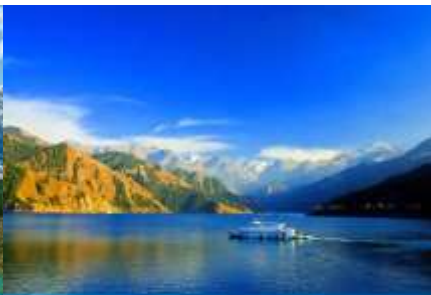
ล่องเรือทะเลสาบเทียนฉือ