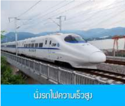
นักรถไฟความเร็วสูง

พักที่ MADISON WEST STATION HOTEL โรงแรมระดับ 4 ดาวท้องถิ่น หรือเทียบเท่าในเมืองหลันโจว