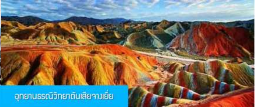
อุทยานธรณีวิทยาตันเสี่ยวเว่ย

วันที่สอง เมืองหลันโจว – นักรถไฟความเร็วสูงสู่เมืองจางเยี่ย – เที่ยวชมอุทยานธรณีวิทยาตันเสี่ยวเว่ย (ภูเขาสายรุ้ง)