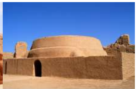
เมืองโบราณเกาซางู๋เจี๋ย