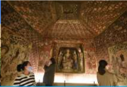
ชมภาพยนตร์ 3 มิติ