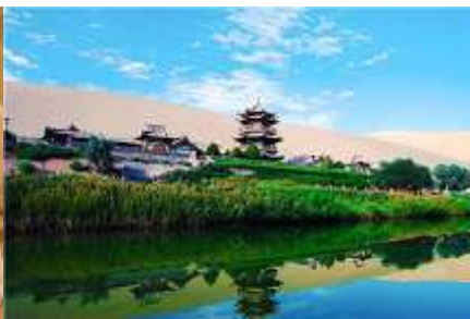
สระน้ำวพระจันทร์