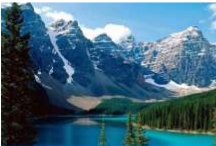
ภูเขาเทียนชาน

พักที่ MERCURE HOTEL โรงแรมระดับ 4 ดาวท้องถิ่นหรือเทียบเท่าในเมืองอูร์มุฉี