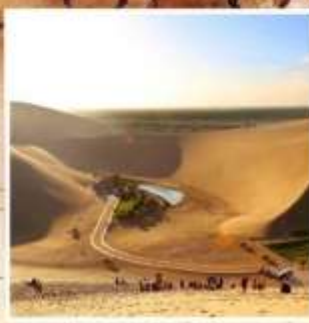
สะพานงพระจันทร์