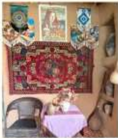
หมู่บ้านอุยกูร์