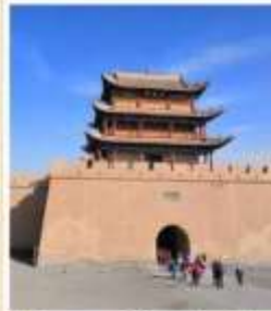
กำแพงเมืองจีนด่านเจียยวี่กวน