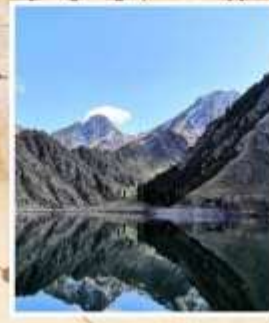
ทะเลสาบเทียนฉือ