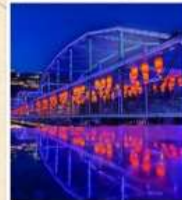
สะพานหวงเหอ ตี้อี้เจียว