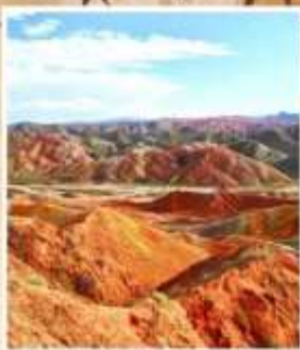
ภูเขาสายรุ้งต้นเซีย