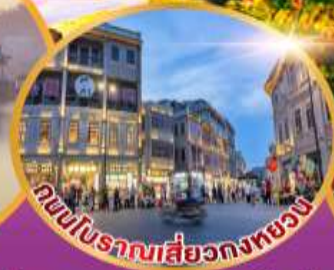
ถนนโบราณที่สวยงาม