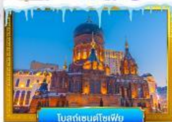
โบสถ์เซนต์โซเฟีย