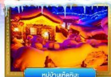
หมู่บ้านหิมะ

เดินทางโดย : สายการบินโซน่าชาเทิร์นแอร์ไลน์