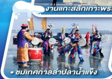
ชมเทศกาลสาปน้ำแข็ง