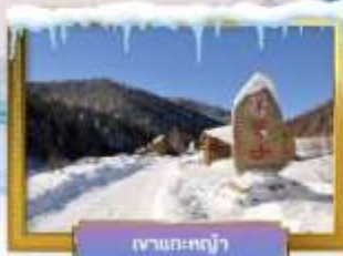
เขาน้ำค้าง