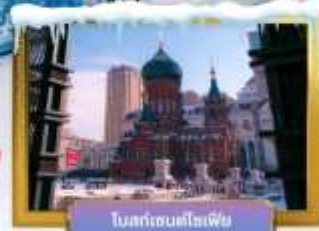
โบสถ์เซนต์โซเฟีย

เดินทางโดยสารบินโซนี่ เซาท์เทิร์น แอร์ไลน์