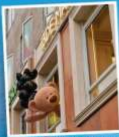
คาเฟ่ 13 DEMARZO