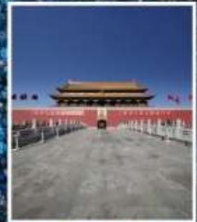
จัตุรัส เทียนอันเหมิน