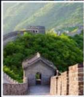
กำแพงเมืองจีน มู่เตียนยวี่