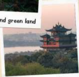
หอเจิ้งหวงเก้อ