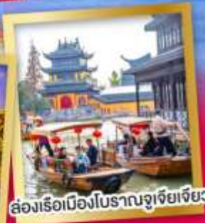
ล่องเรือเมืองโบราณจูเจียเจียว