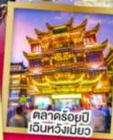
ตลาดร้อยปี เจินหวังเมียว