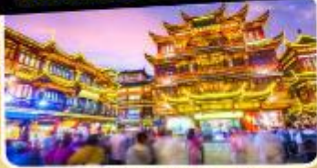
ตลาดร้อยปีเจิ้งหวงเหมียว