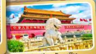
จตุรัสเทียนอันเหมิน