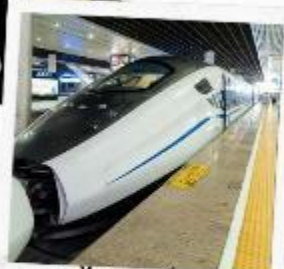
รถไฟความเร็วสูง สู่จี้จ้ายโกว