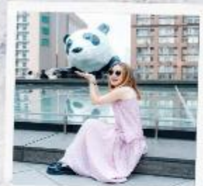
IFS แพนด้าปีนตึก