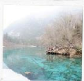
อุทยานจี้จ้ายโกว