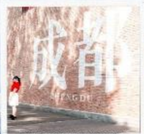
CHENGDU EASTERN MEMORY