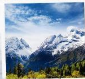
ภูเขาหิมะการ์เซีย ต้ากู่ปิงชวง