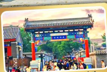
ถนนโบราณหนานหลิวกู่เซียง