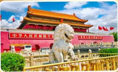
จัตุรัสเทียนอันเหมิน