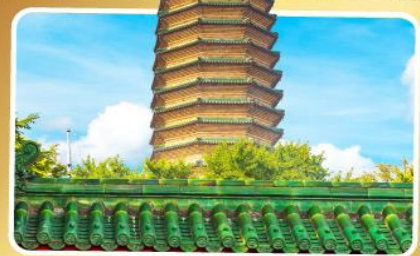
วัดพระเจี๋ยวแกว

เมนูพิเศษ เปิดปักกิ่ง, ชาหมูหม้อไฟ อาหารกวางตุ้ง, อาหารเสฉวน