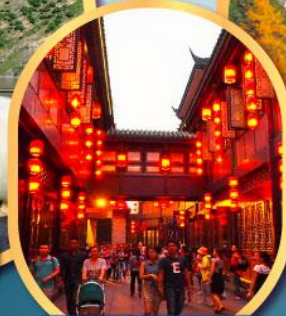
ถนนโบราณจีนหลี่