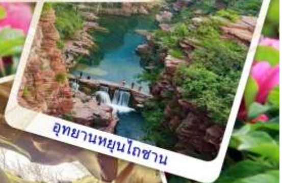
อุทยานหยุนโกซาน