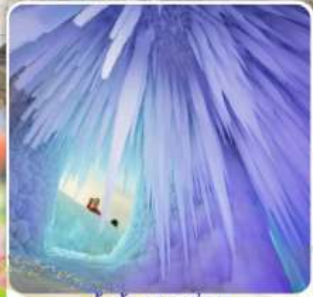
ถ้ำน้ำแข็งหมื่นปี