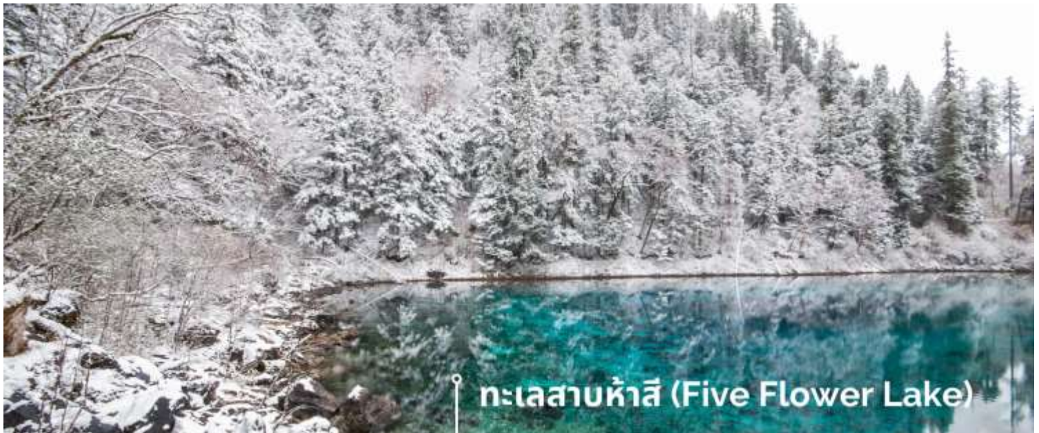
ทะเลสาบห้าสี (Five Flower Lake)

หนึ่งในจุดที่สวยงามและนักท่องเที่ยวแห่มาเยี่ยมชมเยอะที่สุด ตั้งอยู่ที่ความสูงเหนือระดับน้ำทะเลประมาณ 2,472 เมตร น้ำลึกประมาณ 5 เมตร น้ำใสจนเห็นพื้นด้านล่างของทะเลสาบ สีของผิวน้ำสวยงามแปลกตา โดยเฉพาะเมื่อยามแสงอาทิตย์สาดส่องกระทบผิวน้ำ สีของน้ำในทะเลสาบจะสะท้อนเป็นสีส้มถึง 5 เฉดสี สวยงามสะกดตา ซึ่งสาเหตุที่ทำให้เกิดสีสันต่างๆ นี้มาจากการสะสมของแร่ธาตุ และพืชน้ำชนิดต่างๆ โดยจะมีสีสันแตกต่างกันไปตามฤดูกาลและ