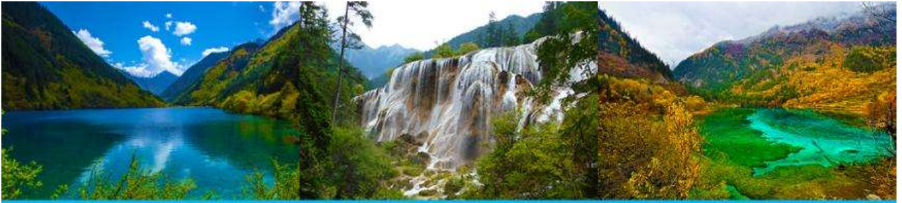
ทะเลสาบแรด (RHINO LAKE)