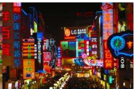
ถนนคนเดินซุบซู่