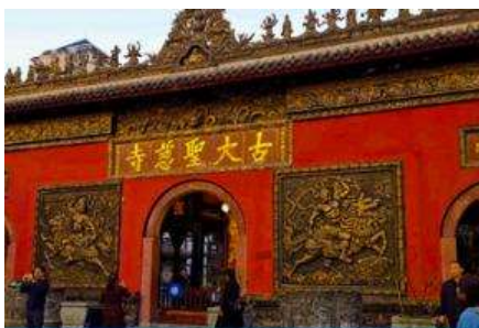
วัดต้าเจี๊ว

พักที่ MAOXIAN INTER HOTEL โรงแรมระดับ 4 ดาวหรือเทียบเท่าในเมืองมา่เจียน