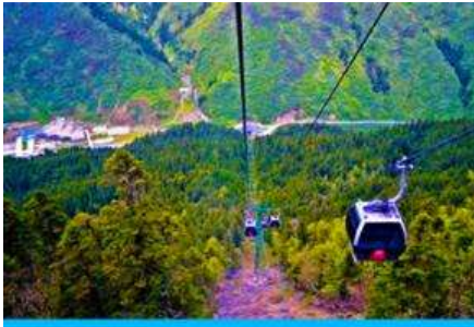
นั่งกระเช้าขึ้นสู่อุทยานหวงหลง