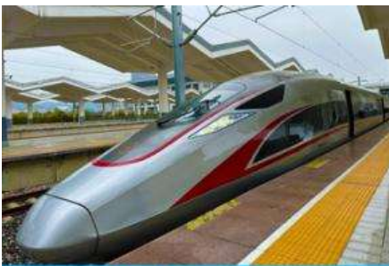
บริการรถไฟความเร็วสูง