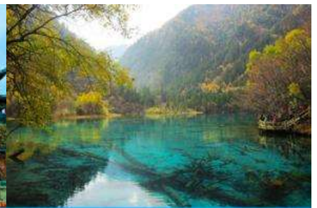
อุทยานจิวจ้ายโกว