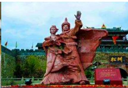
เมืองโบราณซงพาน