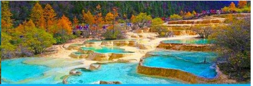
อุทยานหวงหลง