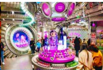
ร้าน POP MART