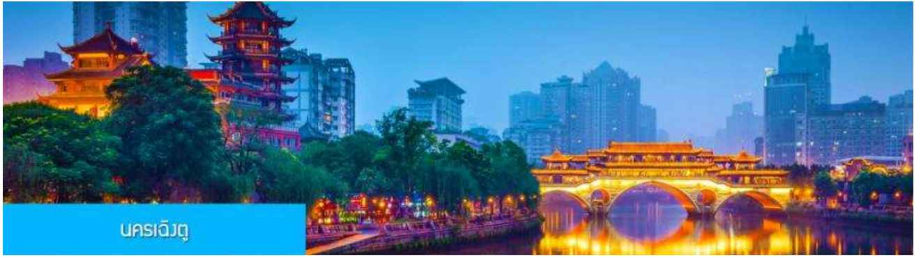
นครเฉิงตู