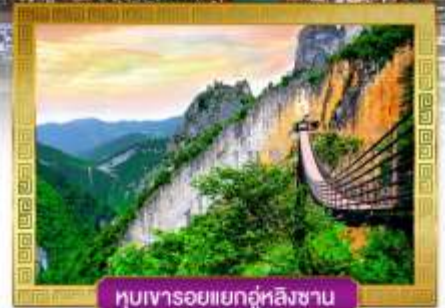
หุบเขารอยแยกอู่หลิงซาน