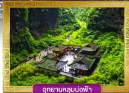
อุทยานหลุมบ่อฟ้า