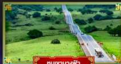
หุบเขานางฟ้า