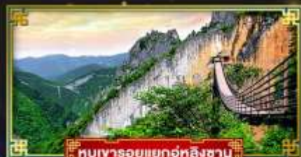
หุบเขารอยแยกอู่หลิงซาบ