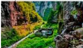
อุทยานแห่งชาติหลุมฟ้า 3 สะพานสวรรค์