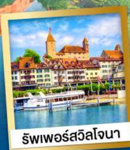
ริวาดีชชีวาโนนา