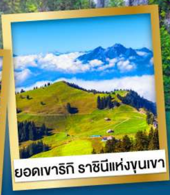
ยอดเขารักิ ราชนีแห่งขุนเขา