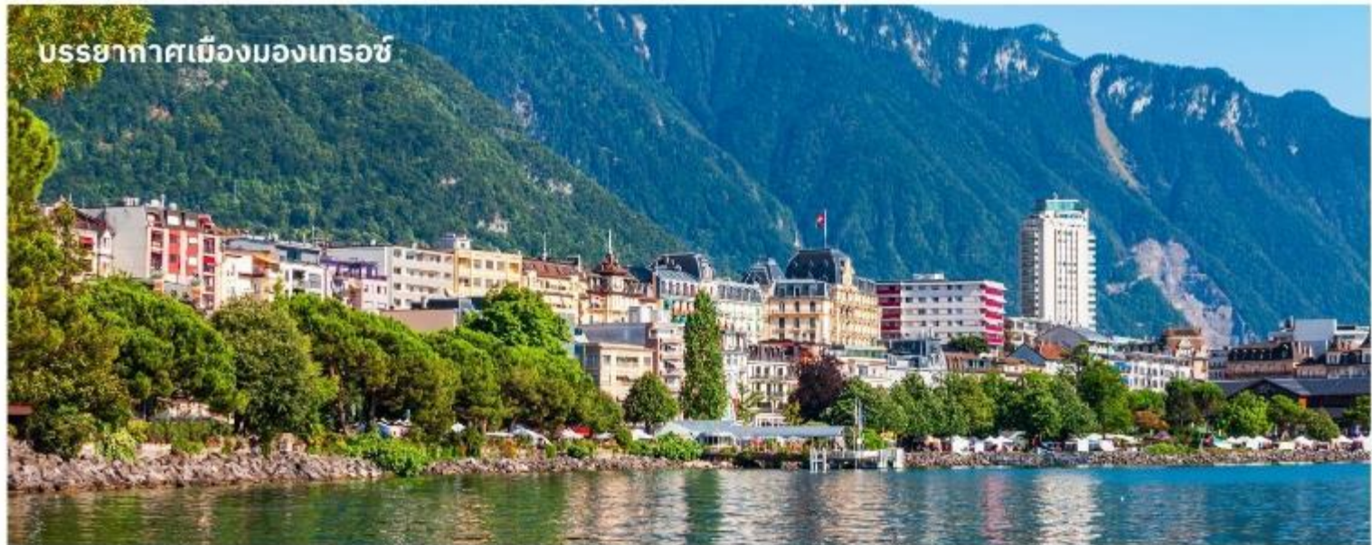
บรรยากาศเมืองมงเทรอร์ช

จากนั้นนำท่านเดินทางสู่ เมืองแทสซ์ (Tasch) ด้วยรถไฟ และเดินทางด้วยรถบัสต่อไปยัง เมืองมงเทรอร์ช (Montreux) ใช้เวลาเดินทางประมาณ 2 ชั่วโมง เมืองตากอากาศที่ตั้งอยู่ริมทะเลสาบเจนีวา ได้ชื่อว่าเป็นริเวียร่าของสวิส ชมความสวยงามของทิวทัศน์ บ้านเรือน ริมทะเลสาบ นำท่านถ่ายรูปด้านหน้า ปราสาทซิลยอง (Chillon castle) ปราสาทโบราณอายุกว่า 800 ปี สร้างขึ้นบนเกาะหินริมทะเลสาบเจนีวา ตั้งแต่ยุคโรมันเรื่องอำนาจโดยราชวงศ์ SAVOY โดยมีจุดมุ่งหมายเพื่อควบคุมการเดินทางของนักเดินทางและขบวนสินค้าที่จะสัญจรผ่านไปมาจากเหนือสู่ใต้หรือจากตะวันตกสู่ตะวันออกของสวิตเซอร์แลนด์ เนื่องจากเป็นเส้นทางเดียวที่ไม่ต้องเดินทางข้ามเทือกเขาสูงชัน ปราสาทแห่งนี้จึงเปรียบเสมือนด่านเก็บภาษีซึ่งเอาเปรียบชาวสวิสมานานนับร้อยปี