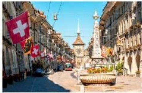
มาร์กาเซ ย่านเมืองเก่า

นำท่านชม บ่อหมีสีน้ำตาล สัตว์ที่เป็นสัญลักษณ์ของกรุงเบิร์น นำท่านชม มาร์กาเซ ย่านเมืองเก่า ปัจจุบันเต็มไปด้วยร้านดอกไม้และบูติก เป็นย่านที่ปลอดภัย จึงเหมาะกับการเดินเที่ยวชมอาคารเก่า อายุ 200-300 ปี นำท่านลัดเลาะชม ถนนจุงเคอร์นกาเซ ถนนที่มีระดับสูงสุดของเมืองนี้ ซึ่งเต็มไปด้วยร้านภาพวาดและร้านขายของเก่าในอาคารโบราณ ชม นวมฟาใช้ทคล็อคเค่นทรัม อายุ 800 ปี ที่มีโชว์ให้ดูทุกๆชั่วโมงในการตีบอกเวลาแต่ละครั้ง นวมฟานี้ ในช่วงปี ค.ศ. 1191-1256 ใช้เป็นประตูเมืองแห่งแรก ภายหลังได้ดัดแปลงใช้ทคล็อคเค่นทรัมให้กลายมาเป็นหอนวมฟาพร้อมติดตั้งนวมฟาดาราศาสตร์เข้าไป