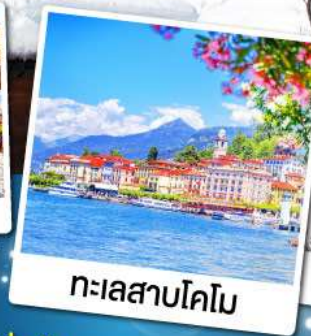
ทะเลสาบโคโม