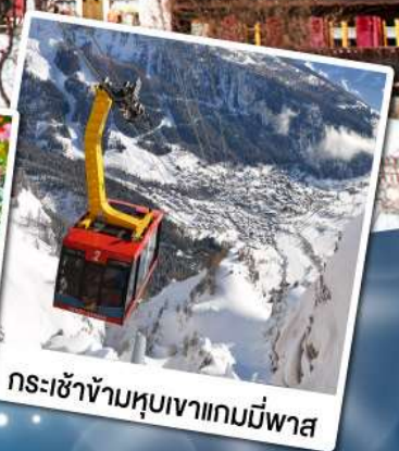
กระเช้าข้ามหุบเขาแกมมีพาส