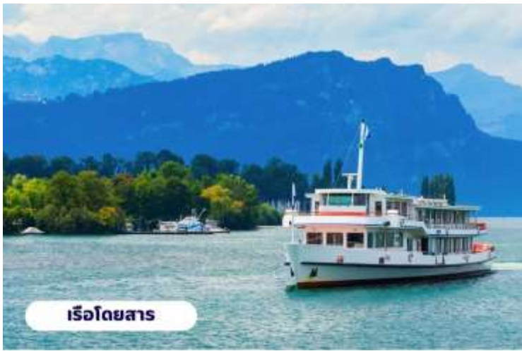
เรือโดยสาร

☉ บริการอาหารเช้า ณ ห้องอาหารของโรงแรม จากนั้นนำท่านเดินทางสู่ ยอดเขาริกิ (Rigi Kulm) โดยใช้การเดินทางโดยเรือจากทะเลสาบลูเซิร์นไปยังท่าเรือวิทซ์เนา (Vitznau) จากนั้นนั่งรถไฟไต่เขา Rigi ถือได้ว่าเป็นรถไฟไต่เขาที่เก่าแก่ที่สุดในยุโรป และยังเป็นอันดับ 2 รองจากยอดเขาวอชิงตัน ในมลรัฐนิวแฮมป์เชียร์ สหรัฐอเมริกา ความสูงจากระดับน้ำทะเล 1,797 เมตร จนมาถึงยอดเขาริกิ (Rigi Kulm) ซื่อนี้มีที่มาจากคำว่า Mons Regina แปลได้ว่าราชินีแห่งภูเขา เพราะสามารถมองเห็นทิวทัศน์ของยอดเขาอื่นๆ ได้รอบ 360 องศา ชมวิวแบบพาโนรามาโอบล้อมด้วยธรรมชาติของทะเลสาบ Luzern และ Zug อิสระทุกท่านถ่ายรูปชมวิวตามอัธยาศัย