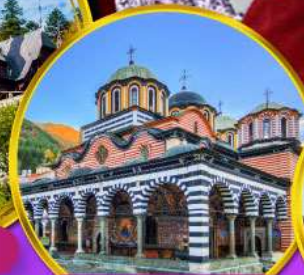
อารามมรดกโลกริลา